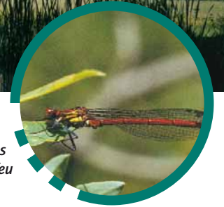
Petite nymphe au corps de feu