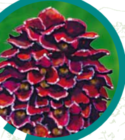
Fleur de sanguisorbe