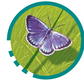
Azuré de la sanguisorbe

Conscient de la valeur écologique du marais, le Conseil général de l'Isère a classé le site comme espace naturel sensible départemental. La gestion en a été confiée à l'agence AVENIR, conservatoire d'espace naturel de l'Isère qui a élaboré en concertation avec la commune de Crolles, les propriétaires et usagers du site le plan de préservation et d'interprétation qui définit les objectifs de conservation et d'animation du site :