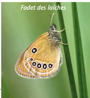
Fadet des laïches